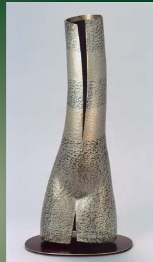
[凛とした] 石川 充宏